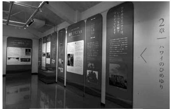
ハワイの海をイメージした2章「ハワイのひめゆり」パネル

期間は2022年2月27日までです。期間はコロナ禍で足を運べない方にも見ていただきたいとウェブ上でも展示内容を公開しています。資料館にて図録も販売中です。通信販売も行っています。