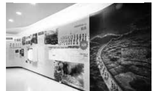
戦場への動員を描いたイラスト

「女師・一高女 最後の1年」では、沖縄戦に至る1年の学校の出来事を新しく追加しました。動員の大型イラストは、いよいよ戦場に向かう生徒たちの状況を表しています。