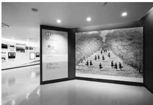
相思樹並木をくぐる登校風景が入館者を迎える

第1展示室は「ひめゆりの青春」から「ひめゆりの学校」に名前が変わりました。学校生活を具体的に紹介することで、今の生徒たちとの共通点がわかりやすくなりました。戦争を体験した人たちがどのような人たちだったかを知ることは、第2展示室以降の戦争についての展示を身近に引き寄せて見ることにつながるのではと、期待しています。