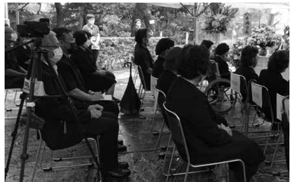
昨年同様小規模での開催となった慰霊祭

資料館の現状を知ったご遺族や来館者のご寄付をお寄せくださったり、リニューアルした展示を見に来たよという方が多くいらっしゃいました。