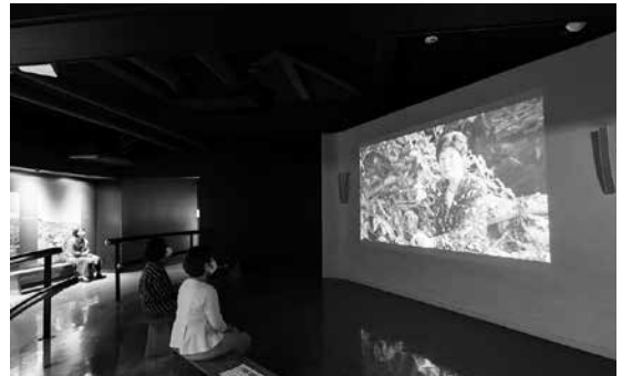
体験者の証言を聞ける場所

ひめゆり学徒の証言を聞くことができるこの展示室は、当館にとって大切な部屋のひとつです。映像を見た入館者から「体験者の話を直接聞いた」という感想が寄せられることもあります。じっくりと証言と向き合うことができる大切な場であるため、大幅な変更は行いませんでした。