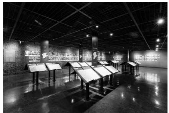
ひめゆり学徒や証言と向き合う空間

新たに、伊原第三外科壕のガマの内部やガマとひめゆりの塔の位置関係がわかる動画、ひめゆり同窓生に歌い継がれ、鎮魂歌として流れている「別れの曲」の説明パネルを設置しました。