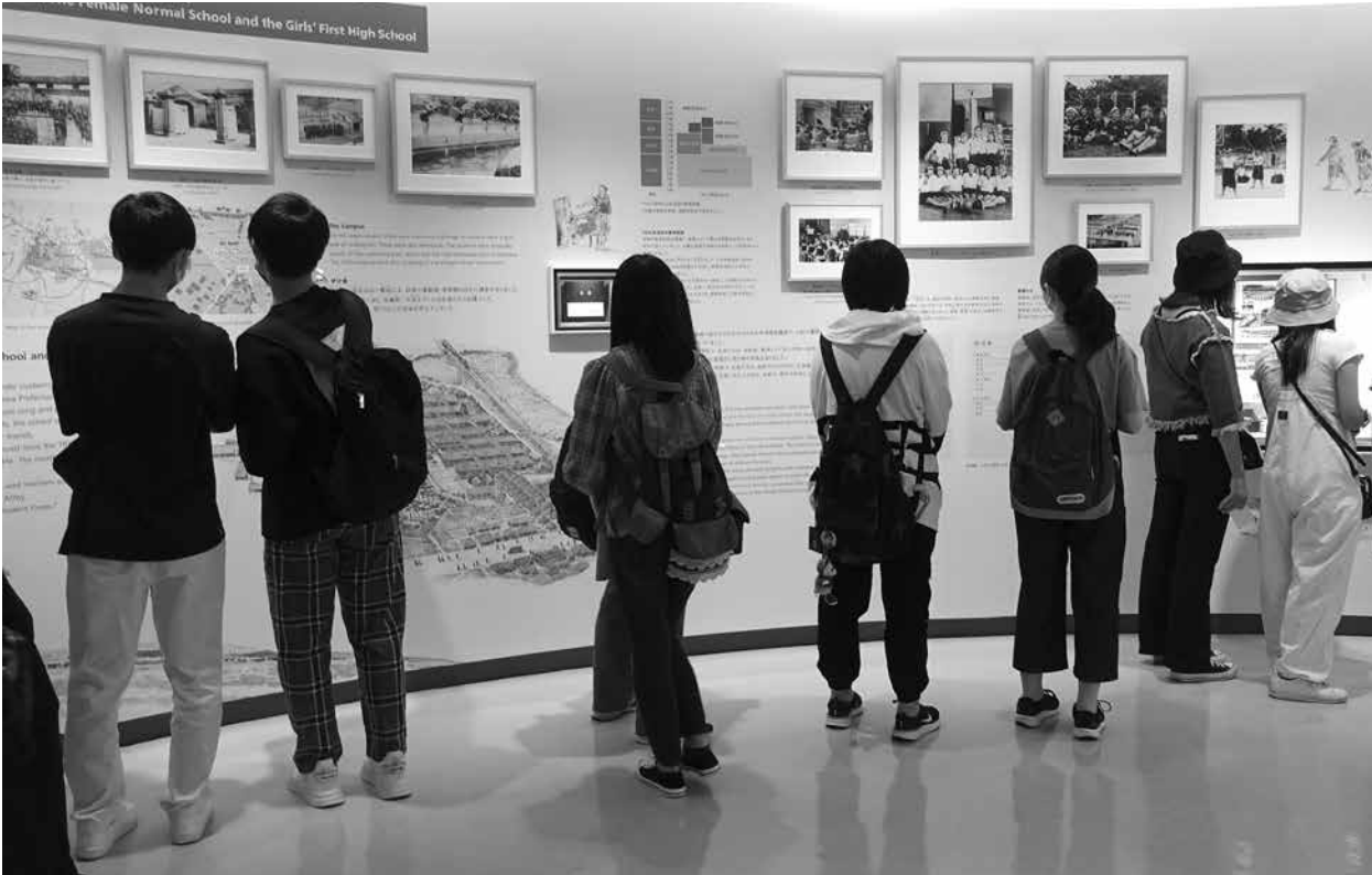
新しい展示を見学する修学旅行生