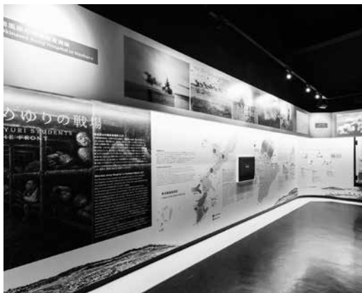
展示室の要所にイラストや動画を設置した

第2展示室は、戦場でのひめゆり生徒の活動を伝えます。説明文だけでは伝わりづらかった生徒の仕事や戦場での様子を、イラストや動画などでより具体的に表現しました。