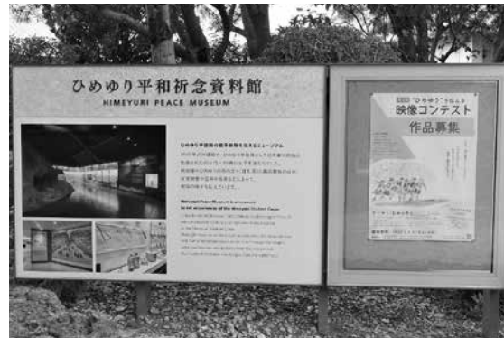
新しく設置された案内板