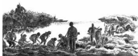
ひめゆり学徒の収容状況のイラスト

「ひめゆり学徒の収容」も新たに追加し、なぜ生徒たちが捕虜になるのを恐れたのか、どのように生き残ったのかを解説します。また、展示室の区分の見直しを行い「解散命令と死の彷徨」までが第2展示室となりました。