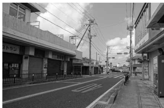
ひめゆりの塔周辺も閑散とした状況だった

10月1日の緊急事態宣言解除を受け、秋以降の修学旅行が動き始めました。しかし、10月は2019年度の約10%、11月以降も約40%にとどまっています。引き続き、皆さまのご支援をどうぞよろしくお願いいたします。