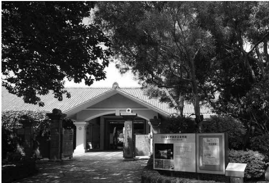
案内板の設置場所

以前から受付には、ここはどういう施設か、どのような展示があるのかといった質問が寄せられていました。そこで、展示室の様子が見える案内板を制作し、資料館の手前に設置しました。掲示スペースでは、イベントや展示会などの紹介を行う予定です。